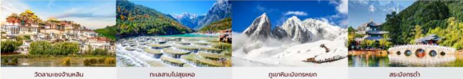
วัดลามะชงจันหลิน