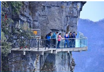
หน้าพลาวยฟ้าทางเดินกระจก