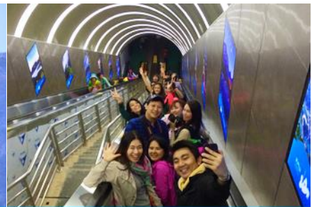
บันไดเลื่อนทะเลภูเขา

วันที่ห้า เมืองโบราณฟงหวง–เมืองจางเจียเจีย-ศูนย์ผลิตภัณฑ์ยางพารา– กระเช้าขึ้นเขาเทียนเหมินซาน ระเบียบแก้วเลียบนหน้าผา – บันไดเลื่อนทะเลภูเขา – (เลือกซื้อโปรแกรมเสริม โชว์ / จิ้งจอกขาว หรือ เมย์ลี่เซียงซี)