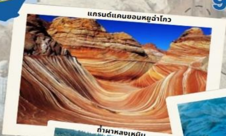
แกรนด์แคนยอนหยูว่าโกว