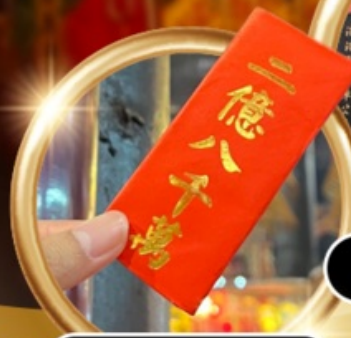
ยืมเงินเจ้าแม่กวนอิม