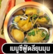
เมนูซีฟู้ดลิ้นจี่