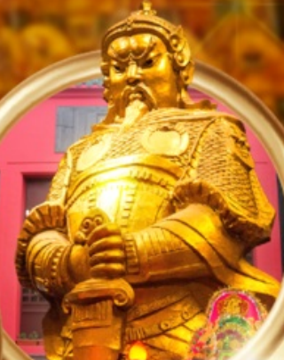
วัดเซกขงหมิว

• วัดเจ้าแม่กวนอิมสองย่า • นั่งรถรางพักผ่อน • อ่าวรีพัลส์เบย์