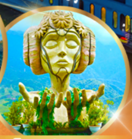
โมนาน่า คาเฟ่