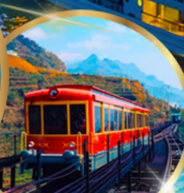
รถราง ซาปา