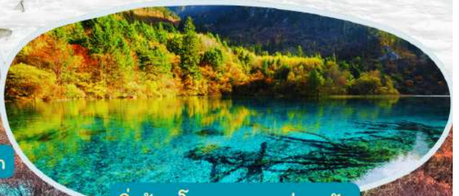
จิวจ้ายโกว รวมรถส่วนตัว