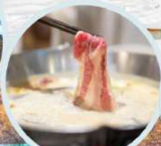
เมนูพิเศษ สุกี้หม่าล่า