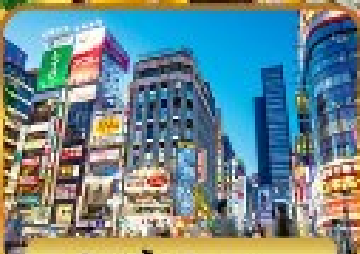
ช้อปปิ้งชิบจุก