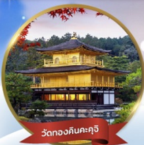
วัดทองคินคะคุจึ