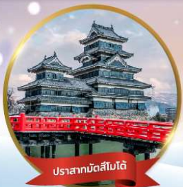
ปราสาทมัตสึโมโด้