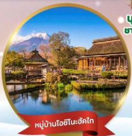
หมู่บ้านโอชิโนะฮักไก