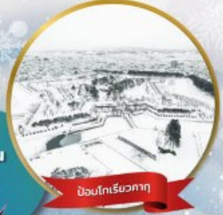
ป้อมโทริเยวคาคุ

หมู่บ้านนิงเกิลเกอเรส • สวนสัตว์อาซาฮิยาม่า • ชมขบวนพาเหรดเพนกวิน ตลาดเช้าฮาโกดาเตะ • ป้อมโทริเยวคาคุ • นั่งกระเช้าชมเมืองฮาโกดาเตะ ลานสกี • HILL OF BUDDHA • โฮตารุ • คลองโฮตารุ • หมู่บ้านรามเม