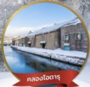
คลองโฮตารุ

13-19 ม.ค. 2568 20-26 ม.ค. 2568 27 ม.ค.- 2 ก.พ. 68