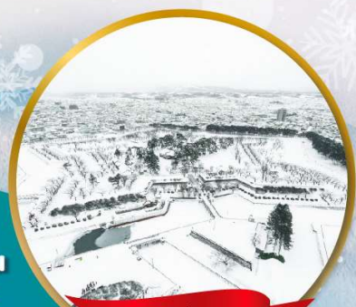
ป้อมโกเรียวกากุ

หมู่บ้านนิงเกิลเกอเรส • สวนสัตว์อาซาฮิยาม่า • ชมบวนพาเหรดเพนกวิน ตลาดเช้าฮาโกดาเตะ • ป้อมโกเรียวกากุ • นั่งกระเช้าชมเมืองฮาโกดาเตะ ลานสกี • HILL OF BUDDHA • ไอตารุ • คลองไอตารุ • หมู่บ้านรามเน