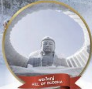
หุบเขา HILL OF BUDDHA