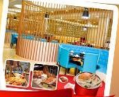
กึ่งแม่น้ำ + HOTPOT SEAFOOD