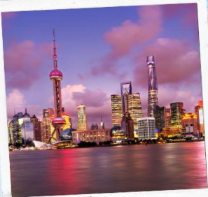
ชมวิวยามค่ำคืน