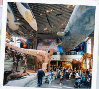
Shanghai Natural history Museum