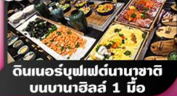
ดินเนอร์บุฟเฟ่ต์นานาชาติ บนบานาฮิลล์ 1 มื้อ