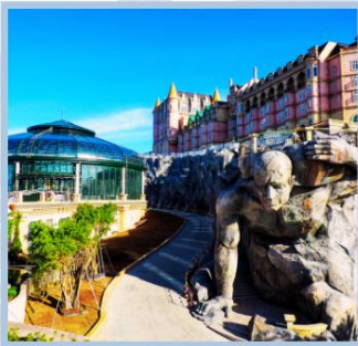
โซลู Eclipse Square