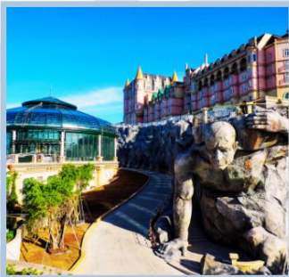
โซอู Eclipse Square