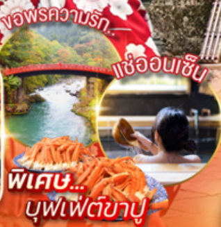
พิเศษ... บุฟเฟ่ต์ชาบู

📍 ไฮไลท์!! สักการะ ศาลเจ้านิกโกะ-โทโชกุได้รับรองเป็นมรดกโลก จาก UNESCO สะกดคาไปกับ ใบไม้เปลี่ยนสี สดใส ณ อุโมงค์เมเน็น หรือ โมมิจิ (ขึ้นอยู่กับฤดูกาล) ขอพรความรัก ณ ศาลเจ้าฟูตาระ-ซัง และเยือนยุคไปกับ หมู่บ้านเอโดะจิว ณ คาวาโกเอะ สักการะสิ่งศักดิ์สิทธิ์ ณ วัดนาริคะ-ชิน พรอมเดินชม ของอร่อยๆ ที่ โอโมเตะ-ซังโตะ นาริคะ