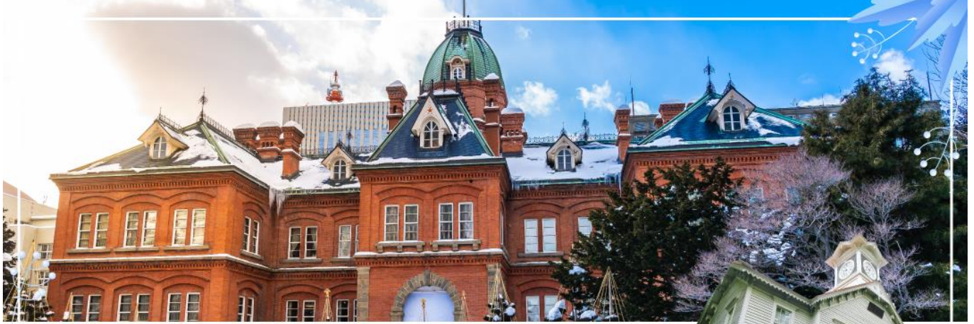
FORMER GOVERNMENT OFFICE BUILDING ที่ทำการรัฐบาลเก่าฮอกไกโด

การรัฐบาลท้องถิ่นสมัยบุกเบิกเกาะฮอกไกโด ปัจจุบันเปิดให้ประชาชนเข้าชมห้องทำงานต่างๆ และ หอสมุดเก็บบันทึกทางราชการ ผ่านชม หอนาฬิกาเมืองซัปโปโร ( Sapporo Clock Tower หรือ ภาษาญี่ปุ่นเรียกว่า Sapporo Tokeidai ) เป็นหอนาฬิกาโบราณมีลักษณะเป็นอาคารไม้ที่มีหลังคา สีสแดงและผนังสีขาวถูกออกแบบและบริจาคให้โดยรัฐบาลสหรัฐอเมริกา ในปี ค.ศ. 1878 เป็น สัญลักษณ์ทางวัฒนธรรมและประวัติศาสตร์ของเมืองซัปโปโร สำหรับตัวนาฬิกาถูกติดตั้งในปี ค.ศ. 1881 จากบริษัท E. Howard & Co. เมือง Boston และในปี ค.ศ. 1970 หอนาฬิกาแห่งนี้ถูกกำหนดให้ เป็นทรัพย์สินทางวัฒนธรรมที่สำคัญแห่งชาติ อีกด้วย