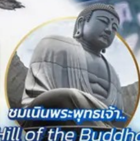
ชมเนินพระพุทธรเจ้า.. Hill of the Buddha

📍 ไฮไลท์!! สนุกสนานกับกิจกรรมทะเลหิมะ- ณ ลานสโนว์ เวิลด์ ฮักไซฟาโนรามา เยี่ยมชมเนินพระพุทธรเจ้า ชมความน่ารักเหล่าสัตว์ ณ สวนสัตว์อาซาฮิยาม่า ชมคลองโอดารุ เข้าชมพิพิธภัณฑ์ถักสโองดนตรี สัมรสราเมง ณ หมู่บ้านราเมนอาซาฮิคาว่า ช้อปปิ้งจุใจ กาบุกุโคโนจิ อีเมอร์ออย!! บุปเฟ่ต์ซาบุมุ และซาบูยูกัน