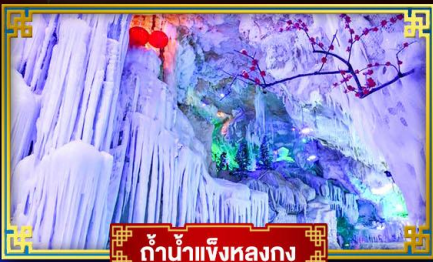
ก้าน้ำแข็งหลงกง

"เที่ยว 2 มณฑล กวางซี-กัชโจว" สุดอลังการ น้ำตก 2 พรมแดน แหล่งท่องเที่ยวระดับ 5A