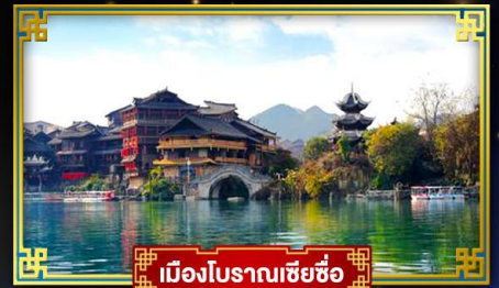
เมืองโบราณเซี่ยซือ