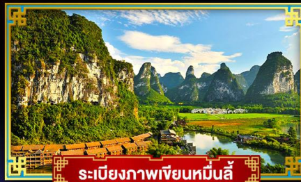
ระเบียงภาพเขียนหมื่นลี้