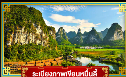
ระเบียงภาพเขียนหมื่นลี้