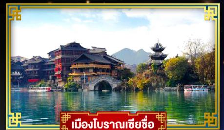
เมืองโบราณเซี่ยซือ