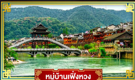
หมู่บ้านเฟิ่งหวง

ชุมชนระดับโลกกลางผาหนมอก "ฟ่านจิ่งชาน" ท่องสู่อินแดนแห่งภาพวาดจางเจียเจีย