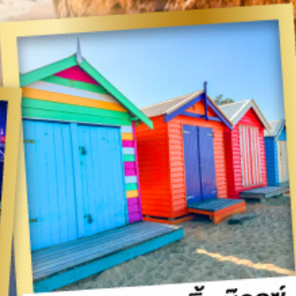
โบสถ์ดิน บาร์ตัง บ็อกซ์