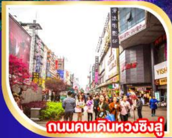
ถนนคนเดินหวงซิงอู่