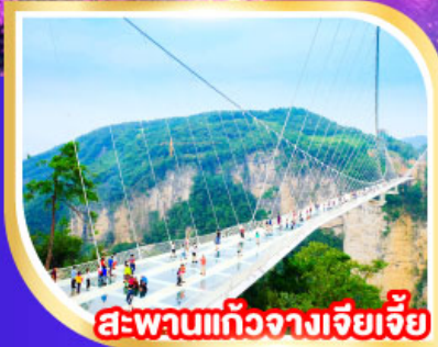
สะพานแก้วฉางเจียเจีย