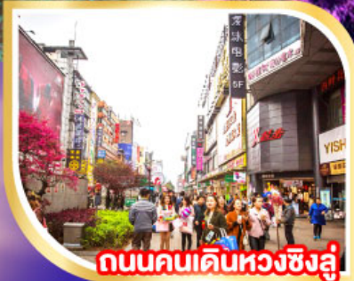
ถนนคนเดินหวงซิงลู่