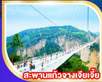
สะพานแก้วจากเจียเจีย