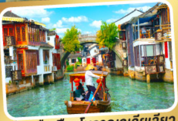
ล่องเรือเมืองโบราณซูเจียเจียว