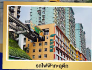
รถไฟฟ้า-ลูตึก