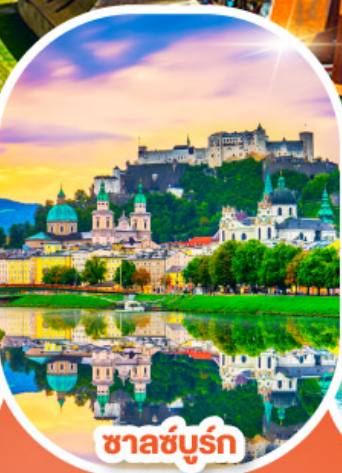
ซาลซ์บูร์ก