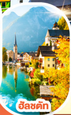
อินส์บรุค