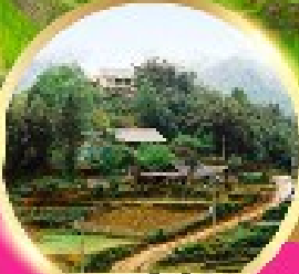
หมู่บ้านก๊อตก๊ต