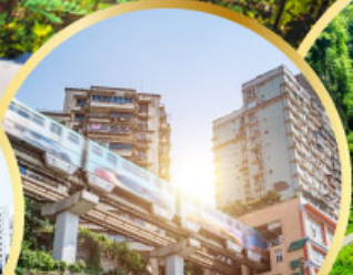
รถไฟฟ้าทะลุติ๊ก หลุมฟ้าสะพานสวรรค์