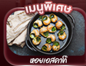
หอยแอสคาท์