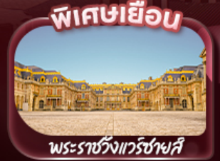
พระราชวังแวร์ซายส์