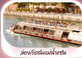
ล่องเรือชมแม่น้ำแซน