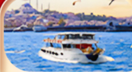
ช่องแคบบอสฟอรัส