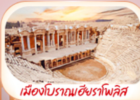
เมืองโบราณฮิราโกลิส