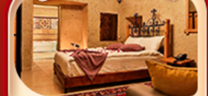
คัปปาโดเกีย