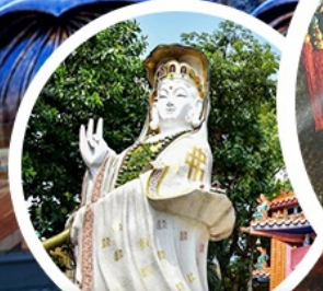
เจ้าแม่กวนอิม รัชลีย์ เบย์