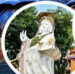
เจ้าแม่กวนอิม รัฟลส์ เบย์