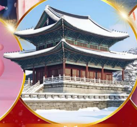
พระราชวังเคียงบกกรุง