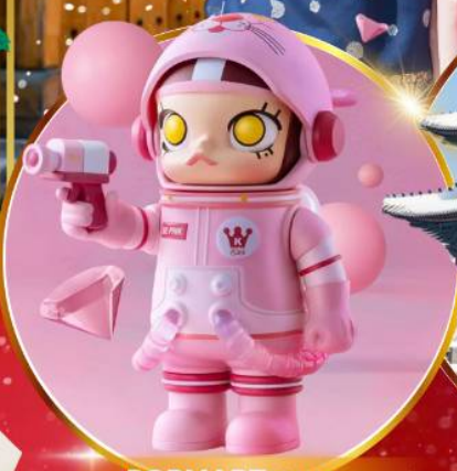
POP MART ฮงแด