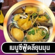
เมมูซีฟู้ดลึยมุม