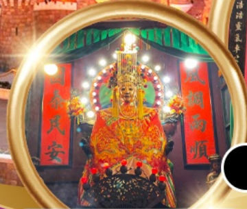
ขอพรซื้อขายอสังหาริมทรัพย์