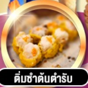
ติ่มซำต้นตำรับ