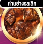
हांอย่างรสเลิศ