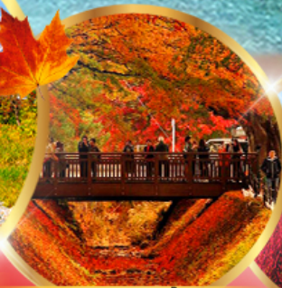
อุโมงค์เมเปิ้ล