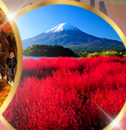
โออิชิ พาร์ค