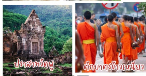
ปราสาทวัดพู