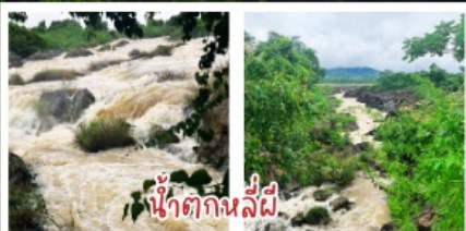
น้ำตกกลี่ผี