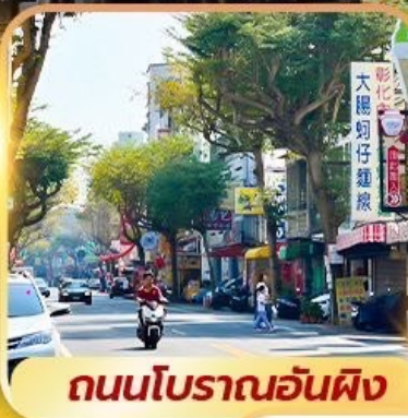
ถนนโบราณอันผิง