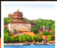
อวิ๋เหอหยวน