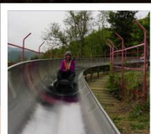
สไลเดอร์ลงจากกำแพงเมืองจีน