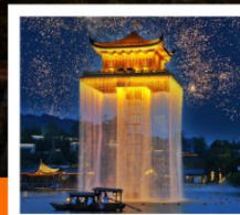
อุโมงค์หวู่

หมู่บ้านสุขุม่อช่างเหอ / อุโมงค์หวู่ ล่องเรือชมแสงสียามค่ำคืน หมู่บ้านโบราณหวงหลิ่ง / สะพานกระจก / เขาหลิงซาน / กระจกแห่งท้องฟ้า หุบเขาเทวดาวังเซียนถู่ / ล่องเรือทะเลสาบซีหู / ถนนคนเดินเหอฟางเจีย