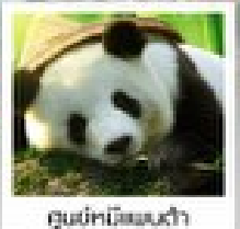
ดูแม่กบิ๊ยนเต้า

อุทยานหวงหลง / อุทยานจิวจ้ายโกว / โรว์ทีเบตดูแม่กบิ๊ยนเต้าเพิ่มเติม / สวนดอกไม้ทิ่กู / เรว์เบิงเท่กั๋ว / ถนนถนนเดินสูบซิ๊ง / ถนนโบราณจีนหนี่