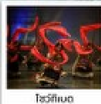
โรว์ทีเบต