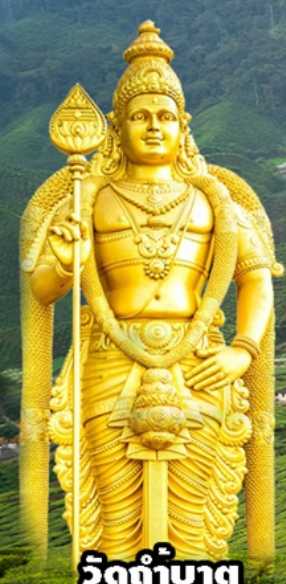
วัดถ้ำบาตุ

ปูตราจายา-คาเมร่อน-เก็นติ้ง-กัวลาลู 3วัน2 คืน โดยสายการบิน มาเลเซีย แอร์ไลน์ (MH)