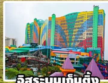
อิสระบนเก็นติ้ง