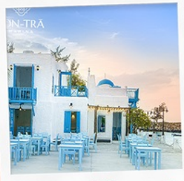
ซานตารีน้ำกาแฟ