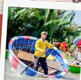
ล่องเรือกระดิง