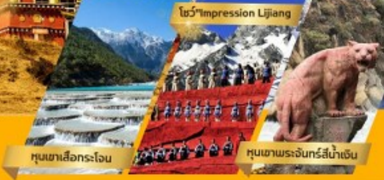
โชว์ "Impression Lijiang"