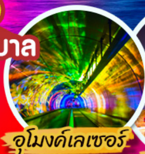
จูโมงด์เลเซอร์