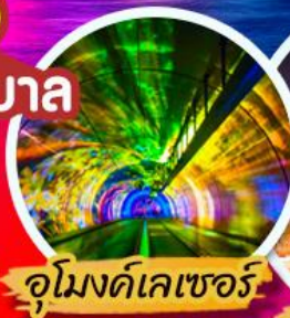
ซูโวมงด์เลเซอร์