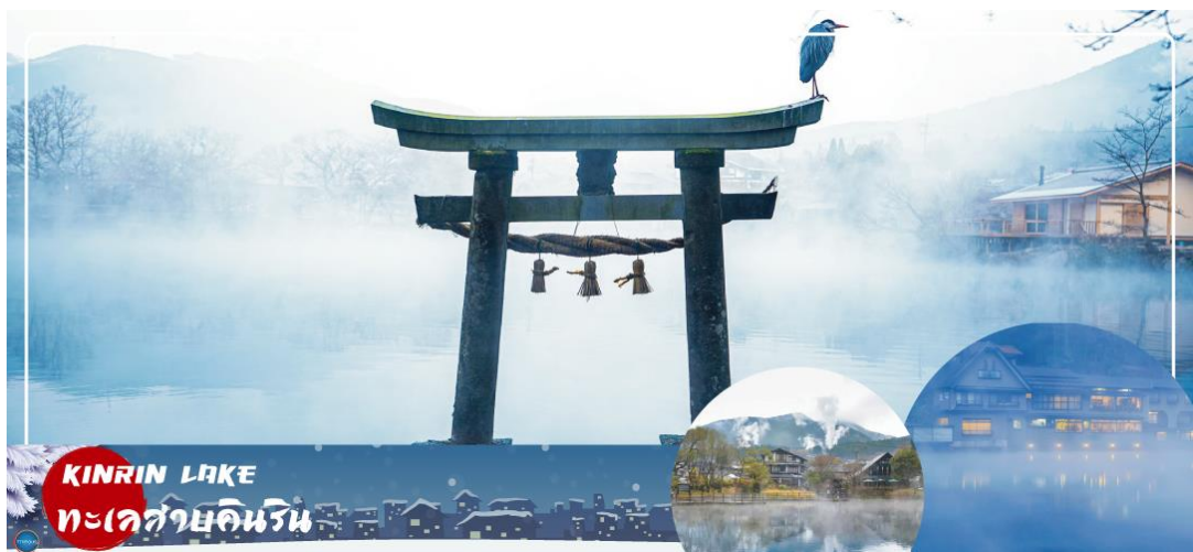
KIRIN LAKE ทะเลสาบคิริน

นำท่านสู่ บ่อนรกเบปปุ จิโกค เมกุริ (Beppu Jigoku Meguri Or Hell Tour) หรือบ่อน้ำพุร้อนชุมชนรกทั้งแปด เป็นบ่อน้ำพุร้อนธรรมชาติที่เกิดขึ้น ภายหลังจากการระเบิดของภูเขาไฟ ประกอบไปด้วยแร่ธาตุที่เข้มข้น เช่น กำมะถัน แร่เหล็ก โซเดียม คาร์บอนเนต เรเดียม เป็นต้น และร้อนเกินกว่าจะลงไปอาบได้ แล้วบ่อทั้ง 8 บ่อ ก็ตั้งชื่อให้แปลกตามลักษณะภายนอกที่เห็น (ให้ท่านเข้าชม 2 บ่อ) นำท่านสู่ เมืองยฟูอิน (Yufuin) เมืองเล็กๆ ในจังหวัดโออิตะ (Oita) ที่รู้จักกันดีในฐานะแหล่งออนเซ็นชื่อดัง และที่นี่ก็เต็มไปด้วยสถานที่น่ารักๆ มีถนนที่เรียงรายไปด้วยคาเฟ่และร้านขายของเก่า ของกระจุกกระจิกมากมาย ระหว่างทางไม่ควรพลาดที่จะแวะ ยฟูอินฟลอรัลวิลเลจ (Yufuin Floral Village) ฮิมปาร์คในบรรยากาศแห่งเทพนิยายที่ดูราวกับกำลังหลงเข้าไปในเหมือนจำลองหมู่บ้านสไตล์ยุโรป ร้านค้าทุกหลังเป็นสีเหลืองที่มีแต่ร้านที่มีสินค้าเป็นเอกลักษณ์ !!! ไฮไลท์ ประจำเมืองยฟูอิน บ้านอิฐที่แสนคลาสสิกเรียงรายอยู่บนถนนสายเล็กๆ ประดับประดาไปด้วยดอกไม้บานานาชนิด ภายในหมู่บ้านมีถนนช้อปปิ้ง มีร้านรวงต่างๆ ที่ตกแต่งได้อย่างน่ารัก ร้านไอศกรีม หรือ คาเฟ่น่ารักๆ อย่าง Alice Tea คาเฟ่สุดชิคบรรยากาศเหมือนอยู่ในป่าและจับน้ำชากับ Mad Hatter หรือจะเป็นร้านขนม ที่มีเค้าโครงมาจาก Kiki's Delivery Service กลิ่นหอมของขนมปังอบอวล น่ากินสุดๆ นอกจากนี้ยังมี จุดพักผ่อนหย่อนใจให้แช่ออนเซ็นทำอีกมากมาย เดินเลยจากถนนช้อปปิ้งไปท่านจะได้พบความงามของทะเลสาบคิริน (Kirin Lake) น้ำทะเลสาบใสเห็นตัวปลาแหวกว่ายในผืนน้ำ บางช่วงมีหมอกบางๆ ลง นับว่าคุ้มค่ากับการมาเห็นความงามนี้ด้วยตาตัวเองสักครั้งนึงอย่างแน่นอน อิสระให้ท่านเดินเล่นและถ่ายรูปตามอัธยาศัย