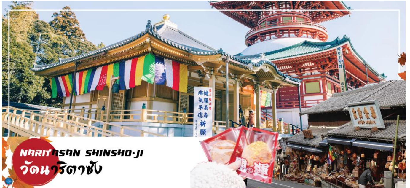
NARITASAN SHINSHO-JI วัดนาริตะชิน

วันที่หก เมืองนาริตะ – วัดนาริตะชิน – ถนนโอมโตะซังโตะ – ย่านโอไดบะ – ห้างไดเวอร์ซิตี – ท่าอากาศยานนานาชาตินาริตะ – ท่าอากาศยานสุวรรณภูมิ