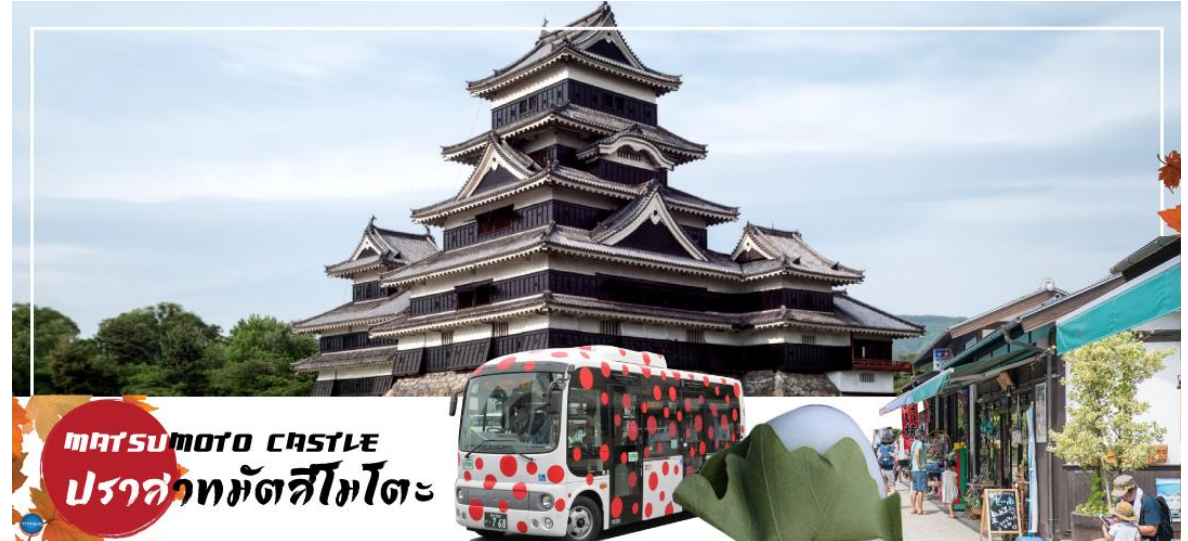
MATSUMOTO CASTLE ปราสาทมัตสึโมโตะ

จากนั้นนำท่านเดินทางสู่ คามิโคจิ (Kamikochi) (ใช้เวลาเดินทางประมาณ 50 นาที) แหล่งท่องเที่ยวทางธรรมชาติที่มีทิวทัศน์ภูเขาที่สวยงามที่สุดแห่งหนึ่งของประเทศญี่ปุ่น ดินแดนแห่งธรรมชาติท่ามกลางหุบเขาแสนสวยของเทือกเขา "เจแปน แอลป์" (Japan Alps) เป็นหุบเขาในพื้นที่อยู่สูงขึ้นไปทางเหนือของเทือกเขาแอลป์ญี่ปุ่น ภาพสายน้ำของแม่น้ำอะซุสะ ที่ใสสะอาดไหลผ่านสะพานคัปปะ ล้อมรอบด้วยต้นป่าเขียวขจี และฉากหลังของยอดเขาสูงตระหง่านระดับ 3,000 เมตรให้ท่านได้เพลิดเพลินกับการเดินเล่นสบายๆ ไปกับธรรมชาติที่สวยงาม อิสระให้ท่านได้เก็บภาพความประทับใจตามอัธยาศัย สะพานคัปปะ-บะชิ เป็นจุดที่มีคนเยอะที่สุดในคามิโคจิ และในบางครั้งก็ให้ความรู้สึกเหมือนทางแยกที่มีชื่อเสียงของชินญะ มีผู้คนมากมายเดินข้ามไปข้ามมาอยู่ไม่หยุดหย่อน มาถ่ายรูปใกล้กับสะพานหรือบนสะพาน นำท่านเดินทางสู่ เมืองมัตสึโมโตะ (Matsumoto) เป็นเมืองที่ใหญ่เป็นอันดับสองของจังหวัดนากาโนะ (ใช้เวลาเดินทางประมาณ 1 ชั่วโมง)