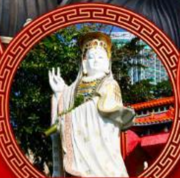
เจ้าแม่กวนอิม รaffles เบย์