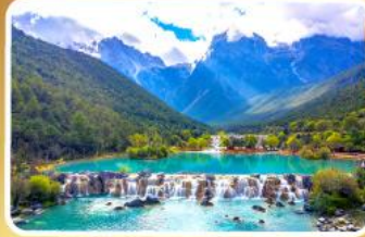
หุบเขาน้ำเงินทะเลสาบโป้สุยเหอ