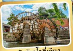
กังหันน้ำลี่เจียง