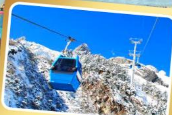
กระเช้าใหญ่ขึ้นภูเขาหิมะมังกรหยก