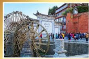
เมืองโบราณแชงกรี่ล่า