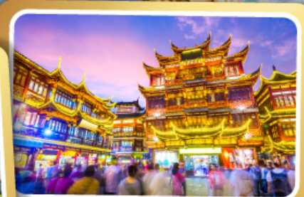
ตลาดร้อยปีเฉิงหวังเมี่ยว

สนุกสุดมันส์ไปกับเครื่องเล่น Shanghai Disneyland เต็มวัน