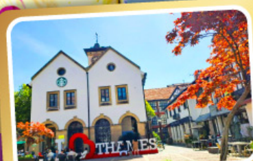
เทมส์ทาวน์