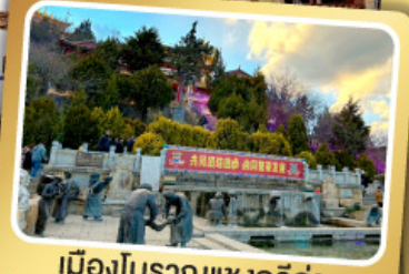
เมืองโบราณแซงกรี่ล่า