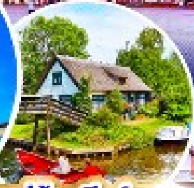
หมู่บ้านกีธูร์น