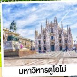
มหาวิหารดูโอโม

09-15 พ.ย. 67 28 ม.ค.-03 ก.พ. 68 12-18 มี.ค. / 11-17 เม.ย. 68 07-13 พ.ค. 68