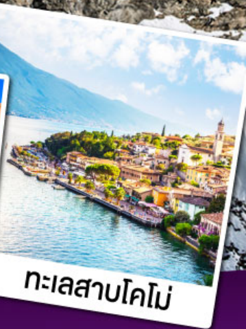
ทะเลสาบโคโม