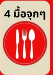
4 มื้อจุกๆ