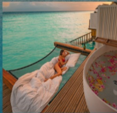
Hammock & Bath tub